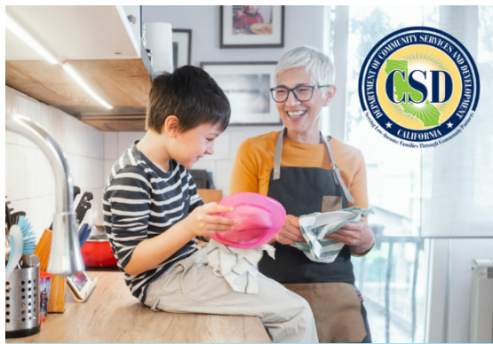
Programa de Asistencia de Agua para Hogares de Bajos Ingresos

Texto alternativo (Twitter): Una niña lava un plato con un trapo azul en el fregadero de la cocina. Superposición de texto en la parte inferior de la imagen: Programa de Asistencia de Agua para Hogares de Bajos Ingresos, obtenga más información: https://www.csd.ca.gov/waterbill , logotipo del Departamento de Servicios Comunitarios y Desarrollo en la esquina superior derecha.