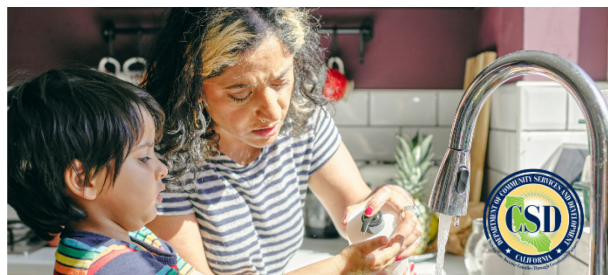
Programa de Asistencia de Agua para Hogares de Bajos Ingresos

Obtenga más información: https://www.csd.ca.gov/waterbill