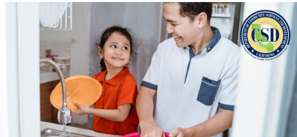
Programa de Asistencia de Agua para Hogares de Bajos Ingresos

Obtenga más información: https://www.csd.ca.gov/waterbill