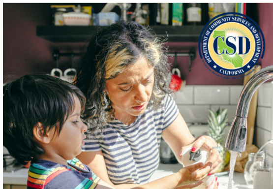
Programa de Asistencia de Agua para Hogares de Bajos Ingresos

Texto alternativo: Una niña y un adulto lavan los platos en el fregadero de la cocina sonriendo y mirándose el uno al otro. Superposición de texto en la parte inferior de la imagen: Programa de Asistencia de Agua para Hogares de Bajos Ingresos, obtenga más información: https://www.csd.ca.gov/waterbill , logotipo del Departamento de Servicios Comunitarios y Desarrollo de California en (esquina superior izquierda [Facebook] o esquina superior derecha [Twitter]).