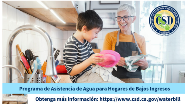
Programa de Asistencia de Agua para Hogares de Bajos Ingresos

Obtenga más información: https://www.csd.ca.gov/waterbill